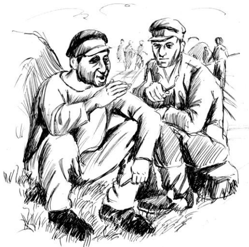
Рисунок Владислава Цана

(Покинув территорию заставы, похоронная процессия двигалась по дороге в полной тишине. Люди в колонне, как и идущие в ее голове пограничники, старались шагать в ногу, а винтовочные штыки и ружейные стволы, поблескивающие над головами людей, придавали картине особенный колорит: наверное, каждый именно сейчас вольно или невольно вспомнил и почувствовал, что рядом, совсем рядом, проходит здесь государственная граница. А по обеим сторонам дороги, покачиваясь под легким ветерком, клонились к земле тяжелые колосья пшеницы. Колхозная нива ждет, когда придут к ней люди, когда загудят на ней моторы машин.