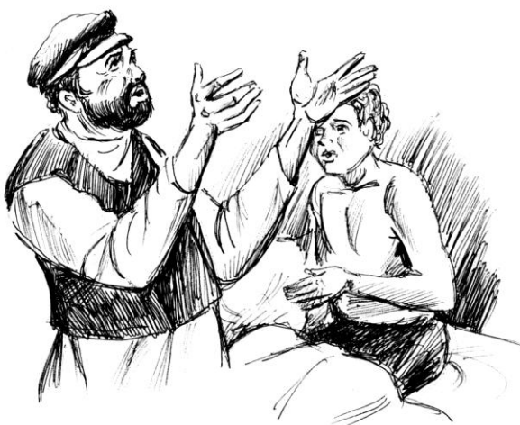
Рисунок Владислава Цана

Было далеко за полдень, когда Либес за стрекотом своей косилки различил непривычный звук. Это «американка» колхозного председателя Партмана, который и его, Либеса, решил попроведать, а перед этим Йойна заметил председательский «фордик» возле растущего стога, где Партман, энергично жестикулируя, о чем-то говорил обступившим его сенокосчикам. Говорил, судя по всему, довольно громко. Ну а о чем там шла речь, отсюда разве расслышишь?