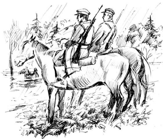
Рисунок Владислава Цапа

будто медленней... Снова переменял направление ветер или ослабло течение? Держись, Бузи, держись!.. Только без паники!..