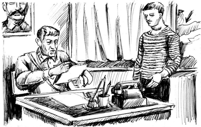
Рисунок Владислава Цана

Слово берет Бузи и, словно продолжая мысль председателя, говорит: