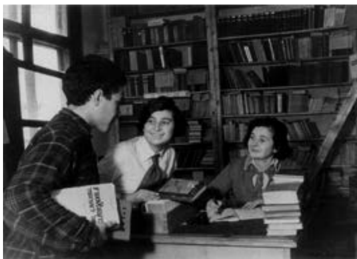
В библиотеке педагогического техникума, Биробиджан.