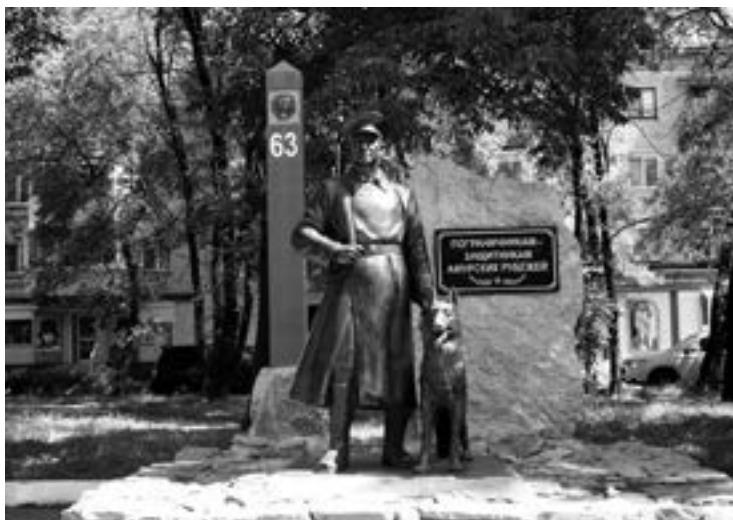
Памятник пограничникам — защитникам амурских рубежей

И хотя на нашем участке не грохочут взрывы мин и снарядов, почти не слышно выстрелов, но по физическому и психологическому напряжению, по огромной ответственности пограничная служба по-прежнему остается одной из самых трудных воинских профессий.