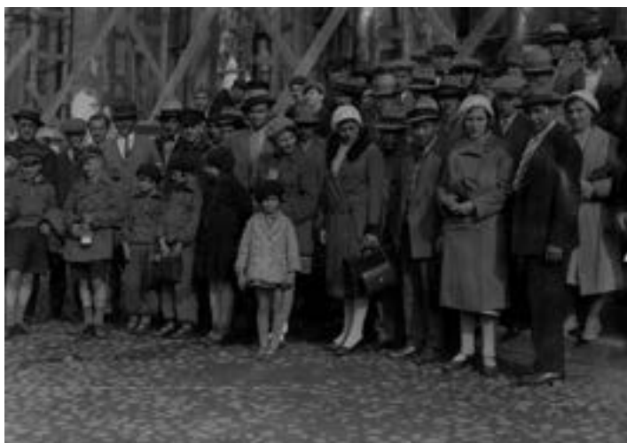
Первая группа переселенцев из Аргентины и Германии на Октябрьском вокзале в Москве, 1931 г.

Прошло шесть лет со времени передачи земель Бирско-Биджанского района для организации еврейского переселения. Численность населения в административных границах Биробиджанского района возросла с 34,2 тыс. чел. в 1928 г. до 52,7 тыс. чел. в 1934 г. К концу следующего года еврейское население достигло 23% от общей численности населения автономии. Это был самый