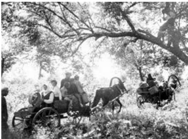
Переселенцы на пути в Бирофельд.