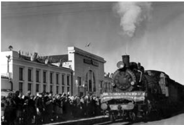
Встреча переселенцев на железнодорожном вокзале г. Биробиджана.