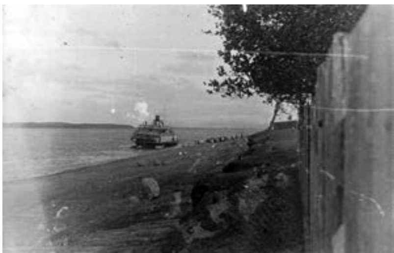
Пароход на Амуре. 1929 г.