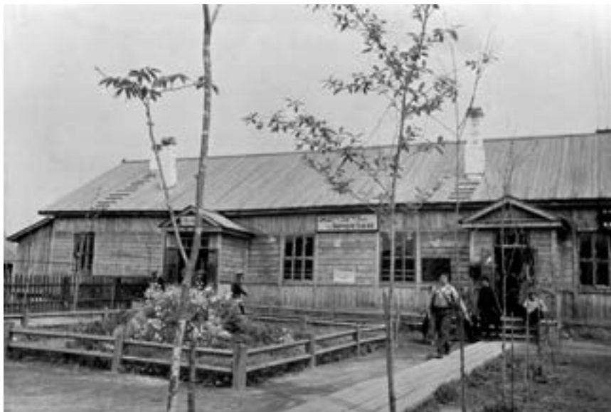
Старый деревянный железнодорожный вокзал станции Биробиджан.

Мощный толчок развитию Тихонькой дало еврейское переселение из западных районов страны в Приамурье. Через два года