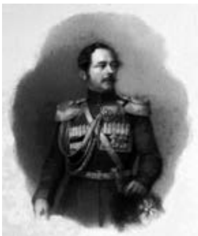
Николай Николаевич Муравьев

На печальном поприще отрицания судоходности Амура отличились известные нам мореплаватели Лаперуз, а также специально посланный для исследования Сахалина и устья Амура Крузенштерн. Закончилось это тем, что дело изучения судоходности Амура застопорилось и было решением царя Николая I прекращено.