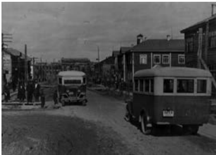
Улица Октябрьская Биробиджана, 1930-е гг.

С началом застройки города встал вопрос о строительстве электростанции. Еще в 1931-1932 годах при торфяных изысканиях в Биробиджанском районе было отмечено, что «по своим энергетическим ресурсам болото «Тихонькое» допускает организацию на нем электростанции мощностью до 35000 киловатт, вполне обеспечивающую на первое время потребности промышленности». В сведениях о разведочных работах на Бирском каменноугольном месторождении и о работе экспедиции Наркомзема на Дальнем Востоке за май 1936 — февраль 1939 годов содержится такая информация: «Болото «Тихонькое» является частью торфяного массива. По имеющимся сведениям, для эксплуатации пригоден участок, расположенный на северо-западе от ст. Биробиджан на расстоянии 3-5 км от нее. Данный участок при правильной эксплуатации на срок 25 лет может ежегодно давать 25-30 тонн торфяного топлива...».