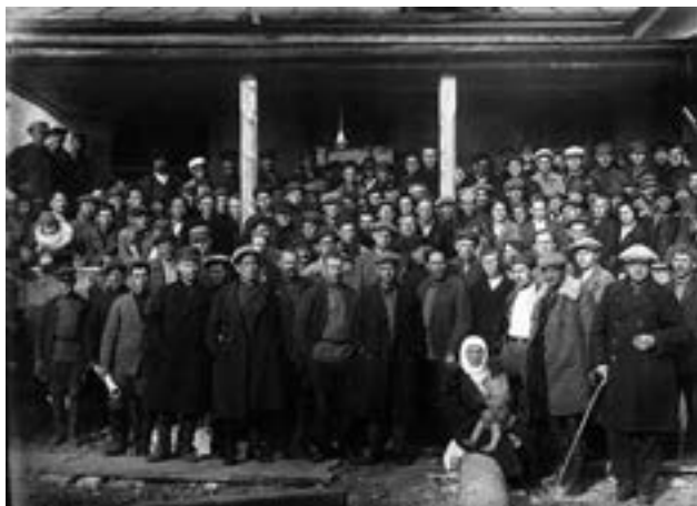
Первый съезд Советов Биробиджанского национального района. Станция Тихонькая, 30 сентября 1930 г.

На территории района функционировали органы местного