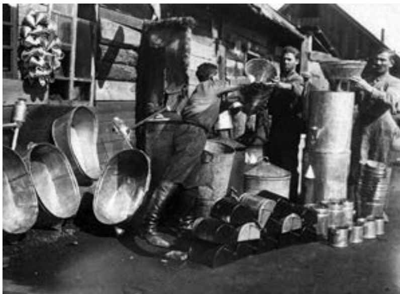
Артель жестящиков, Биробиджан. 1935 г.

Застраивался рабочий поселок. В канун 15-летия Октябрьской революции решением возглавляемого им президиума Биробиджанского городского совета свои наименования получили первые улицы Биробиджана — Октябрьская, Постышевская (ныне Ленина), Партизанская (сегодня это Шолом-Алейхема), а Валдгеймовской назвали нынешнюю Советскую.