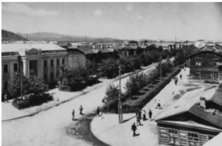
Улица Ленина (бывш. Постышева)

Стройконторы «Биробиджанстрой», переселенческого отдела НКВД и «Кустжилстрой» (впоследствии ликвидированный) в