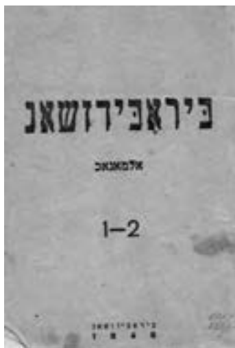
Литературный альманах «Биробиджан» №1-2 1946 г.

После смерти Сталина, когда пост главы государства занимал Н.С. Хрущев, в жизни жителей Еврейской автономной области значительных перемен не произошло. Как и в стране в целом, так и в области в частности развивались промышленность и сельское хо-