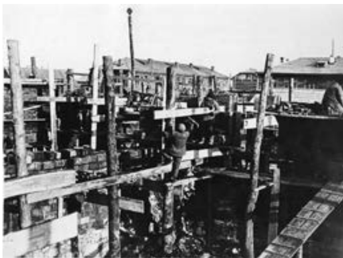
Строится кинотеатр в Биробиджане.

Крыша этернитовая, столбы из бутового камня, архитектурное оформление - деревянные карнизы, пилястры, наличники, отопление печное: что представлял собой город на Бире в тридцатые годы прошлого века.