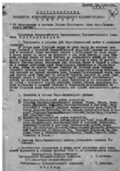
Постановление Президиума ВЦИК «Об образовании в составе Дальне-Восточного края Биро-Биджанского района»

В состав района вошли Екатерино-Никольский и Михайло-Семеновский районы полностью: селения Хингано-Архаринского