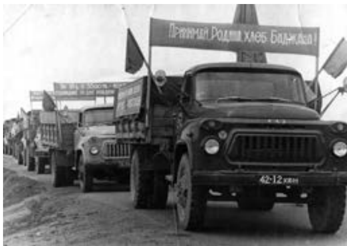
Принимай, Родина, хлеб Биджана! Из фондов областного краеведческого музея

Особое внимание было уделено развитию агропромышленного комплекса, организации новых совхозов, строительству крупных животноводческих комплексов, включению в оборот новых сельскохозяйственных земель, что вызвало острую нехватку трудовых ресурсов на селе, в первую очередь специалистов — механизаторов, животноводов. Оказалось, что огромной шефской помощью города селу решать проблему нехватки кадров для сельского хозяйства области уже было невозможно. Поэтому была активизирована работа по переселению специалистов из западных и центральных