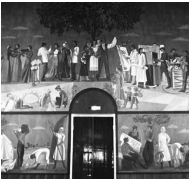
Художественное панно в Биробиджанском городском Дворце культуры

Заключительная статья сборника — аналитический обзор о социально-экономическом развитии Еврейской автономной области, временной охват в статье 1960-е — начало 2000-х гг.