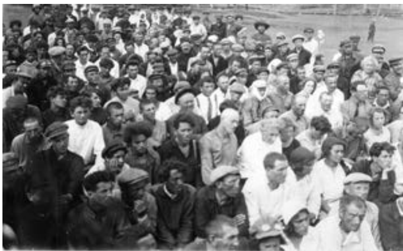
На открытии первого еврейского сельсовета в Бирофельде, 22 июля 1928 г.