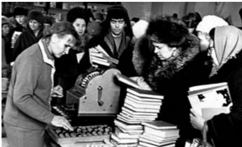
В книжном магазине Биробиджана

Повышался уровень и качество жизни жителей области. Активно развернулось жилищное строительство, ставшее частью новой социальной политики, проводимой в эти годы. С 1965 года областной центр застраивался по единому генеральному плану, целыми микрорайонами. Показательны высокие темпы строительства жилья. Ведется активное строительство «хрущевок» — типовых кирпичных домов с небольшими квартирами, пришедших на смену двухэтажным деревянным жилым домам без коммунальных услуг в них. С 242 тыс. кв. м в 1963 г. до почти 1 млн. кв. м в 1980 г. увеличился