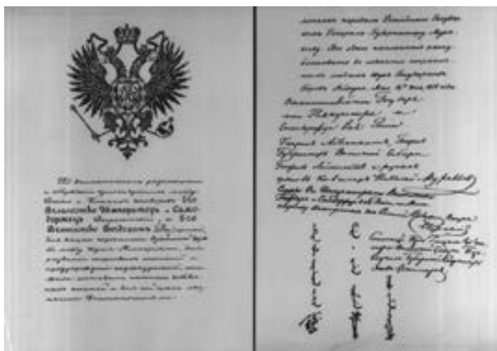
Первая и последняя страницы Айгунского договора

20 мая Муравьев отправил царю подлинный договор с сопроводительным письмом. «Его Императорскому Величеству Генерал-гу-