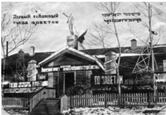
Здание, в котором проходил первый районный съезд Советов.

В повестке съезда было пять главных вопросов: «Ликвидация округов, организация Биро-Биджанского района и его задачи», «Хозяйственное состояние района и его перспективы», «О переселении», выборы руководящих органов райисполкома и текущие дела.