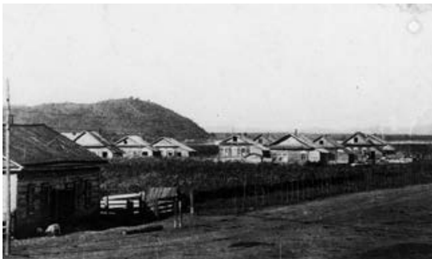
Общий вид поселка Амурзет. Фото В. Гириовича, 1937 г. Из фондов областного краеведческого музея

22 июня, как и планировал Лев Григорьевич, в новом поселке на Амуре состоялись выборы сельсовета. «Из 195 зарегистрировавшихся избирателей приняло участие в выборах 142. Избран сельсовет в составе 13 человек и 4 кандидатов к ним, ревизионная комиссия из 3 человек и 1 кандидата. На первом пленуме сельсовета, состоявшемся 30 июня при массовом участии переселенцев,