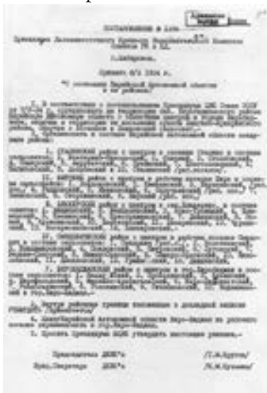
Копия постановления президиума Далькрайисполкома от 08.10.1934 г., определившего административно-территориальное устройство созданной Еврейской автономной области

После второго рождения района число входящих в его состав сельских советов уменьшилось с одиннадцати до восьми. Степановский отошел к Ленинскому району, Михайло-Архангельский и Карла Либкнехта объединили с соседними сельсоветами. Впоследствии эти села исчезли с карты области.