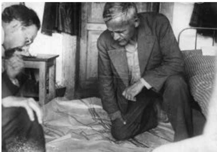
Проектирование большого Биробиджана. Профессор Ханнес Мейер (справа) за просмотром проекта, 1933 г.

Как и рассчитывали организаторы еврейского переселения, Биробиджан становится центром еврейской культуры. Здесь развивается социальная сфера, строятся новые школы, больницы, еврей-