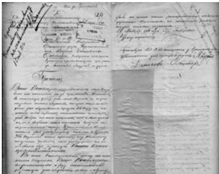
Обращение жителей разъезда Тихоньякая в Приамурское генерал-губернаторство по утверждению созданного правления сельского общества

На том месте, где он поставил свое первое жилище — землянку,