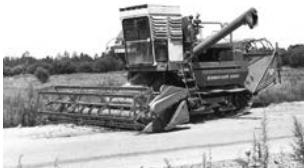
Гусеничный рисо-зерноуборочный комбайн производства завода Дальсельмаш

В лексикон экономистов, просто рабочих в эти годы входят такие понятия, как хозрасчет, хозяйственная самостоятельность, самофинансирование и самоокупаемость, коллективный подряд, материальная заинтересованность и другие.