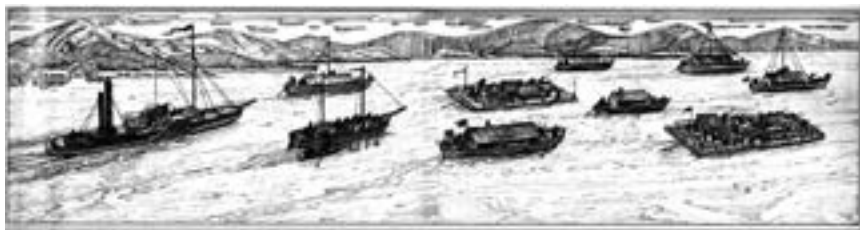
Панорама амурских сплавов.

В марте 1856 года после заключения мира с англичанами было принято решение о возвращении части войск с устья Амура. Была снаряжена третья экспедиция, которую подготовил Корсаков — помощник губернатора. На 118 судах - лодках, баржах, плотках - более 1600 солдат сопроводили около 300 тысяч пудов продовольствия и других грузов. А в середине июля флотилия, оставив продовольствие и солдат на четырех постах (Кумарском, Усть-Зейском, Хинганском и Сунгарийском), прибыла в Мариинский пост.