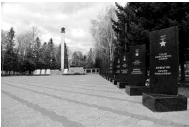
Сквер Боевой и Трудовой Славы в г. Биробиджане

Статьи данной части сборника повествуют о принятых в период Второй мировой войны мерах по укреплению обороноспособности российского Дальнего Востока, непосредственно граничащего с милитаристической Японией, оккупировавшей приграничную Маньчжурию, о том, как жители, предприятия и организации Еврейской автономной области в годы войны перестроили свою жизнь и работу для нужд фронта и внесли свой вклад в победу над врагом. Читатели имеют возможность познакомиться с командующим Дальневосточным фронтом генералом армии Иосифом Родионовичем Апанасенко, стратегия которого сделала невозможным вторжение военных сил Японии на Дальний Восток.