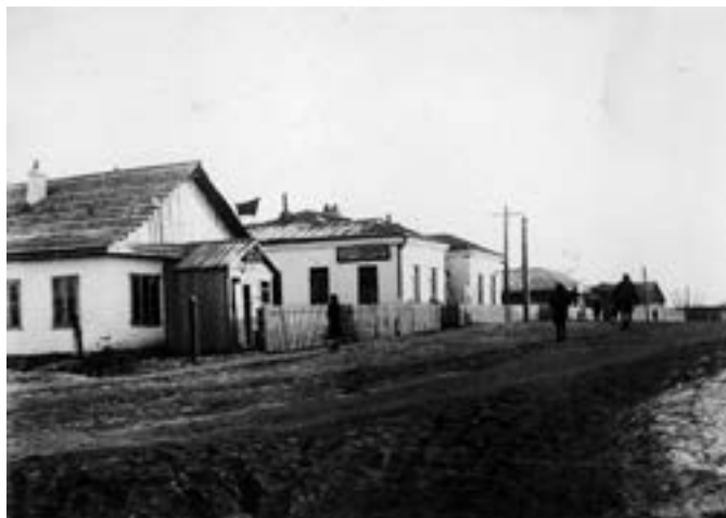
Здание милиции и Биробиджанского представительства ОЗЕТ, Биробиджан

На территории Дальневосточного края отмечался значительный рост уголовной преступности, главным образом преступлений против личности. Рост уголовной преступности был обусловлен тем, что при разделении осенью 1938 года Дальневосточного края на Приморский и Хабаровский края территория Еврейской автономии во много раз больше была «засорена» криминальными эле-