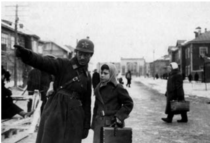
На Октябрьской улице Биробиджана.

Статьи данной части сборника расскажут о первых народных судьях, областной прокуратуре и первых ее сотрудниках, становлении милиции, органов государственной безопасности, формировании пограничной Службы и развитии органов социальной защиты на территории области.