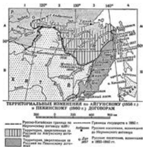
Карта-схема территориальных изменений по Айгунскому (1858 г.) и Пекинскому (1860 г.) договорам между Россией и Китаем.

Айгунский договор и сегодня является юридическим обоснованием принадлежности к России южной территории современного