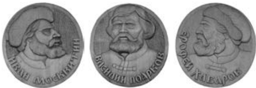
Российские первопрододцы Иван Москвитин, Василий Поярков и Ерофей Хабаров