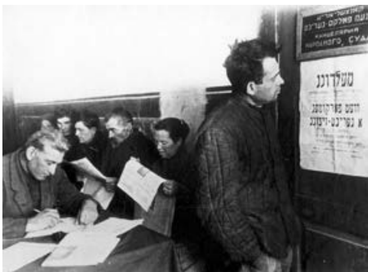
В приемной областного суда.

В документах 1930-х годов встречаются упоминания о сельских