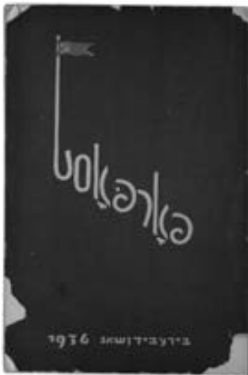
Журнал «Фортост» №1 1936 г.

После выхода в свет постановления ЦК ВКП(б) «О репертуаре драматических театров и мерах по их улучшению» гонения обрушились на Биробиджанский государственный еврейский театр (БирГОСЕТ) имени Кагановича. Теперь перед театром ставилась задача не сохранения еврейской культуры, а показ спектаклей в духе требований партии, которые свидетельствовали бы о преимуществе