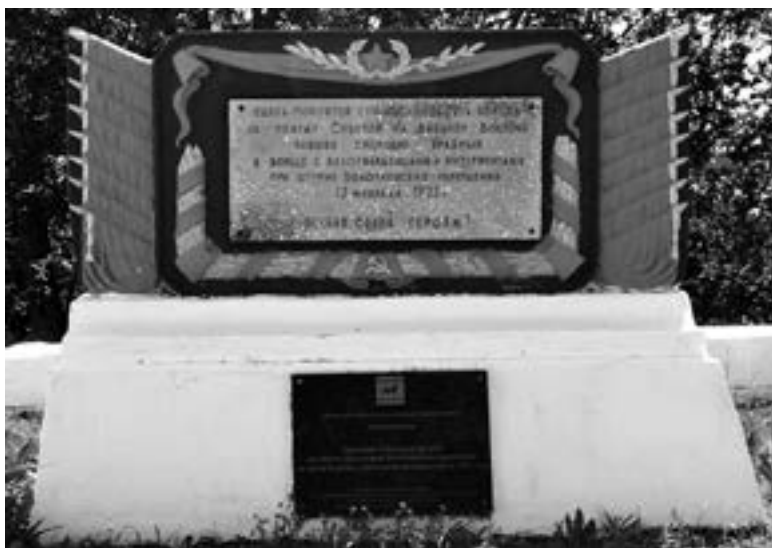
Мемориальная доска на братской могиле на Волочаевской сопке

Таким образом, районное руководство в количестве 5 человек осуществляло управление на территории с 27 населенными пун-