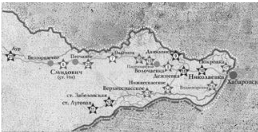
Карта мест боевых действий на территории Смидовичского района в годы Гражданской войны

Примером такого исполнительного комитета был Тунгусский волостной исполнительный комитет, образованный в конце 1922 года после завершения Гражданской войны на Дальнем Востоке. Тунгусская волость в границах современной территории Еврейской автономной области занимала восточную часть Смидовичского района, начиная с Волочаевки.