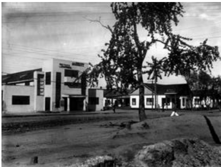
Здание, театра ГОСЕТ, в котором проходил первый районный съезд Советов.

Читатель познакомится с судьбами первых руководителей исполнительных, партийных и комсомольских органов Биробиджанского национального района и Еврейской автономной области, чей блестящий ум, энергия и организаторский талант способны были реализовать в полной мере Биробиджанский проект, но в итоге послужили для них личной катастрофой и для многих расстрельной статьёй.