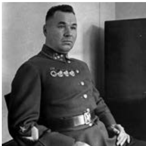
Иосиф Родионович Апанасенко

Февральская, а затем Октябрьская революция 1917-го подстегну-