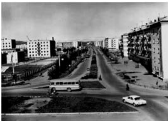
Улица Пионерская в г. Биробиджане

А в это время на улицах города Биробиджана, многих сел и поселков идиш звучал так же часто, как и русский. В область стали приезжать творческие люди — известные писатели и поэты, которые работали в местных газетах, на радио, писали на родном