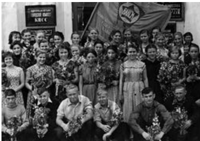
Комсомольцы Биробиджана.

В 1943 году почин комсомольцев хабаровского завода им. Горького, начавших сбор средств на строительство второй эскадрильи «Хабаровский комсомол», был немедленно подхвачен комсомольцами Биробиджана. На строительство второй эскадрильи боевых самолетов «Хабаровский комсомол» первыми начали сбор средств комсомолки-стахановки цеха, где начальником был т. Панев, подхватили призыв комсомольцы и рабочие хлебозавода. За полчаса комсомольцы собрали 4 тысячи рублей наличными и на 5 тысяч рублей облигациями госзаймов. 8 человек отчислили свой недельный заработок, 11 — двух и трехнедельный заработок.